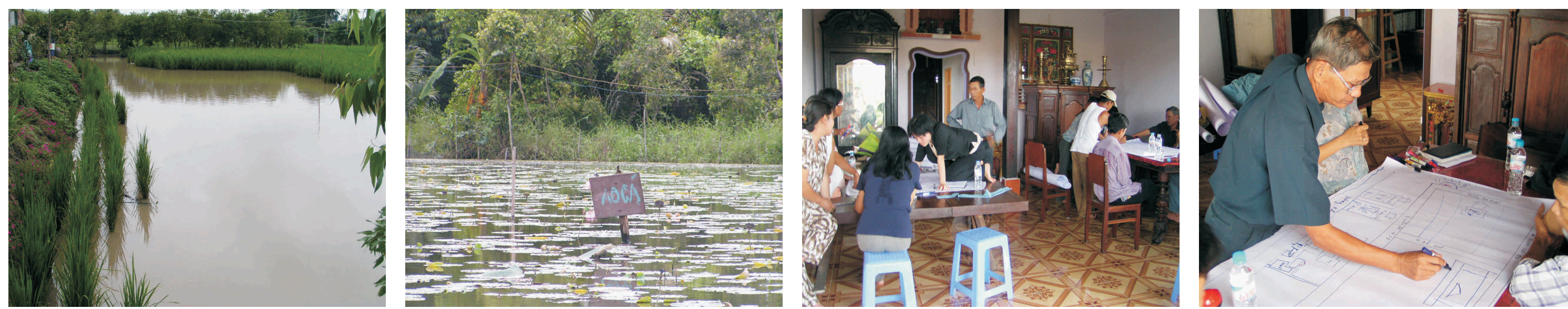
Mô hình nuôi kết hợp cá rô, Mô hình nuôi kết hợp cá rô, Phân chia nhóm theo giới, Noãng ñản trình bày về công ñoàng và hệ thống sản xuất (nhóm nữ)