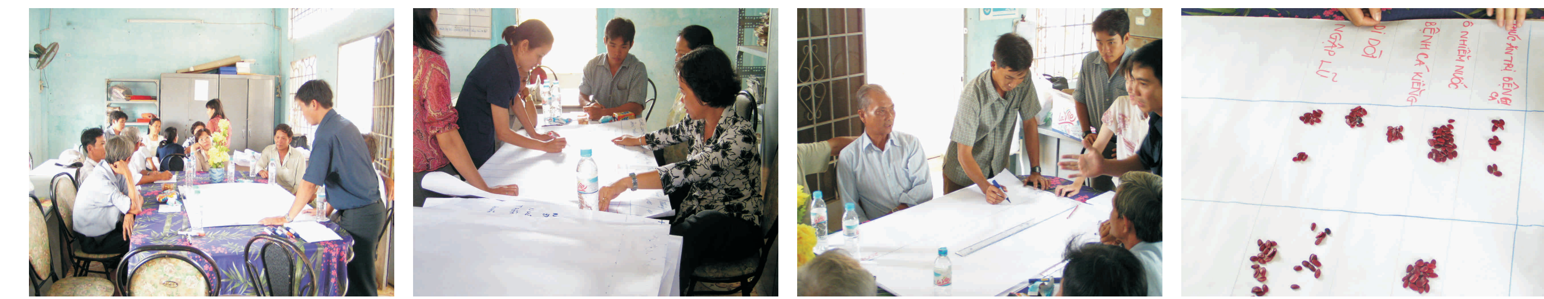
Phân chia nhóm theo giới, Noãng ñản trình bày các loại thức phẩm thông dụng, Noãng ñản trình bày các số liệu quan trọng, Các khâu khâu của người dân trong sản xuất