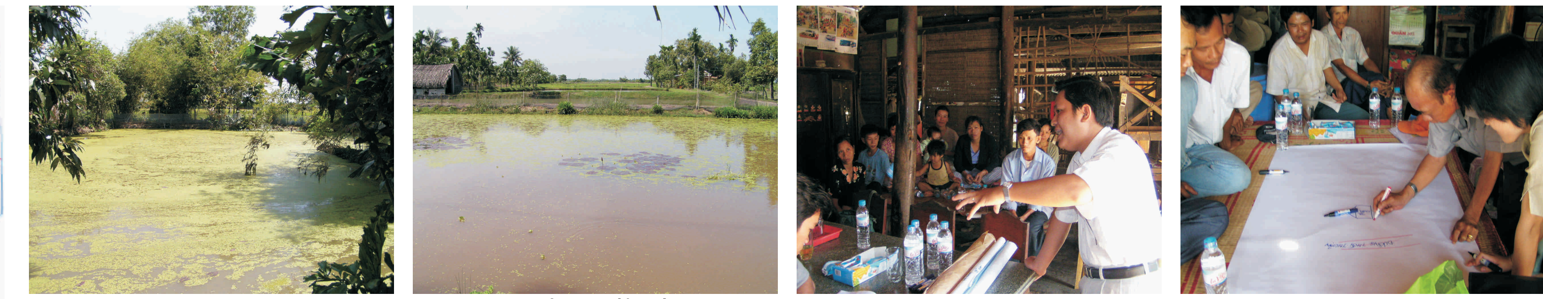
Ao nuôi cá rô, Ao nuôi cá rô, Giỏii thiệu mức ñích nuôi PCA, Noãng ñản trình bày về công ñoàng và hệ thống sản xuất (nhóm nam)