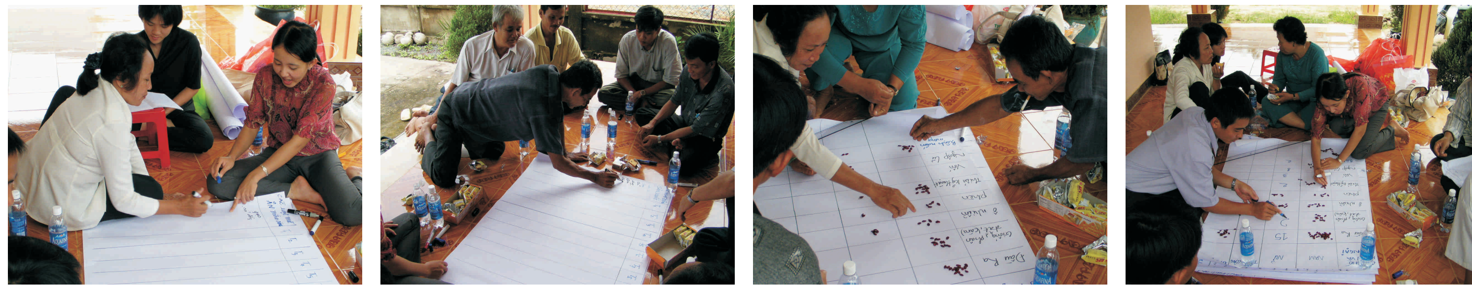
Noãng ñản trình bày các loại thức phẩm thông dụng, Noãng ñản trình bày các hoạt ñoàng trong ngày, Noãng ñản trình bày những khâu khâu trong hoạt ñoàng sản xuất, Tổng kết và xếp loại những khâu khâu