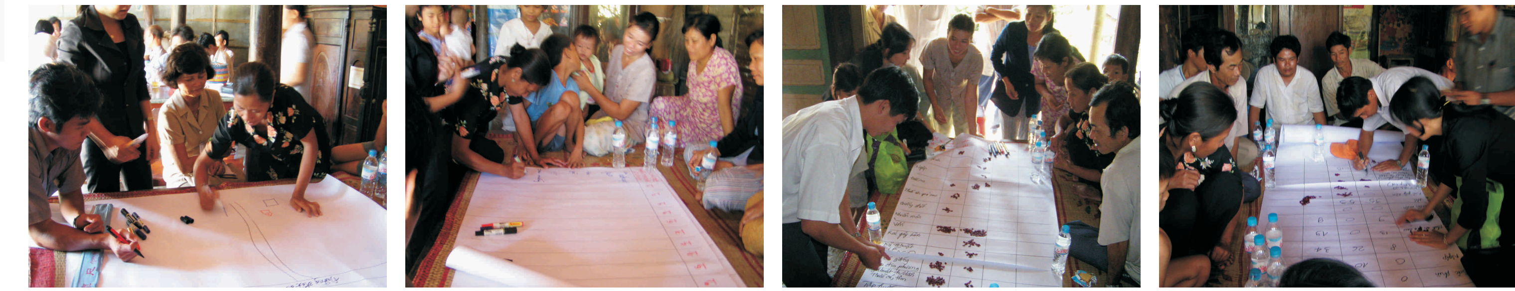
Noãng ñản trình bày về công ñoàng và hệ thống sản xuất (nhóm nam), Noãng ñản trình bày mùa vụ sản xuất, Noãng ñản trình bày những khâu khâu trong hoạt ñoàng sản xuất, Tổng kết và xếp loại những khâu khâu