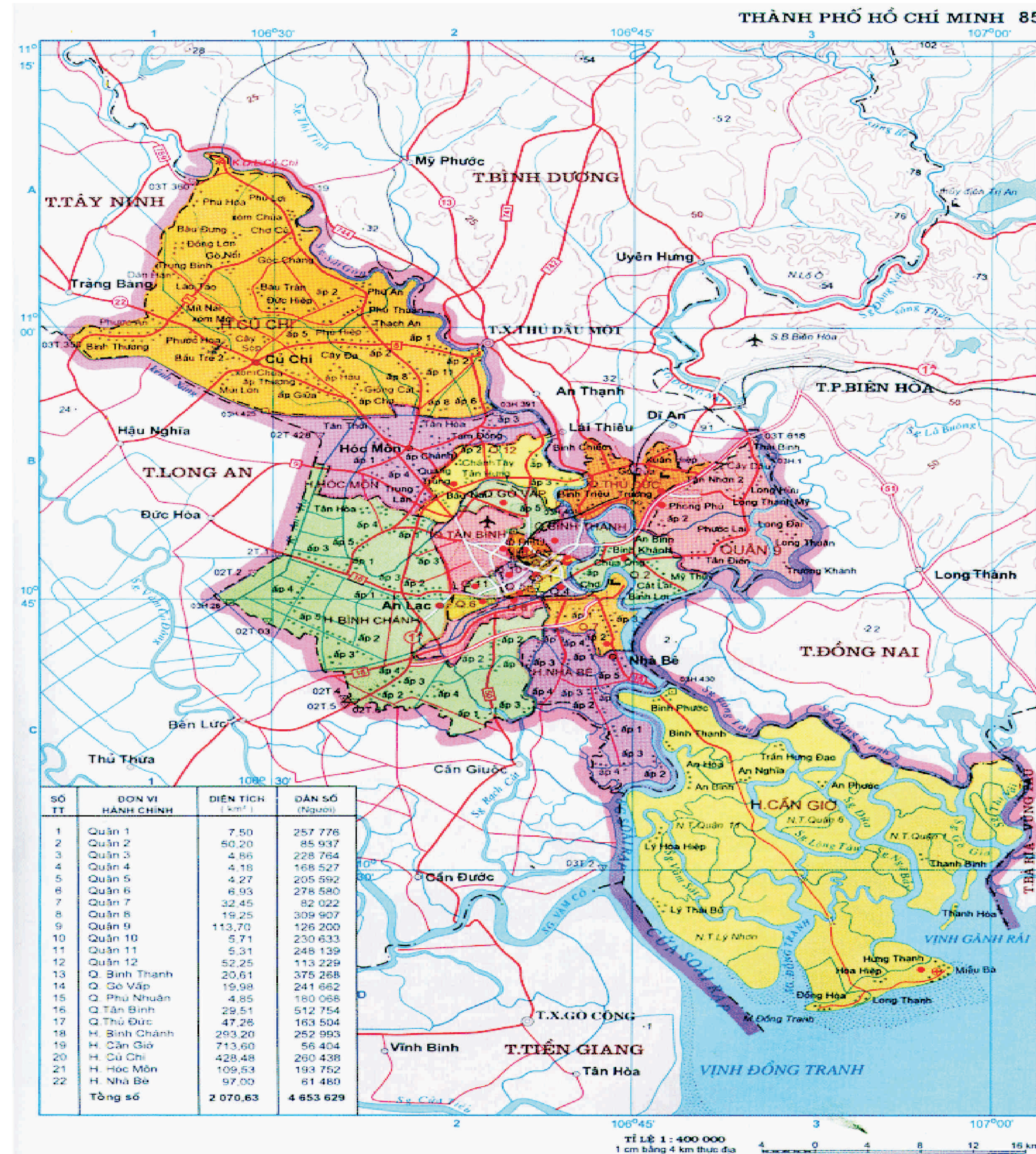
THAØNH PHAÙ HOÀ CHÍ MINH