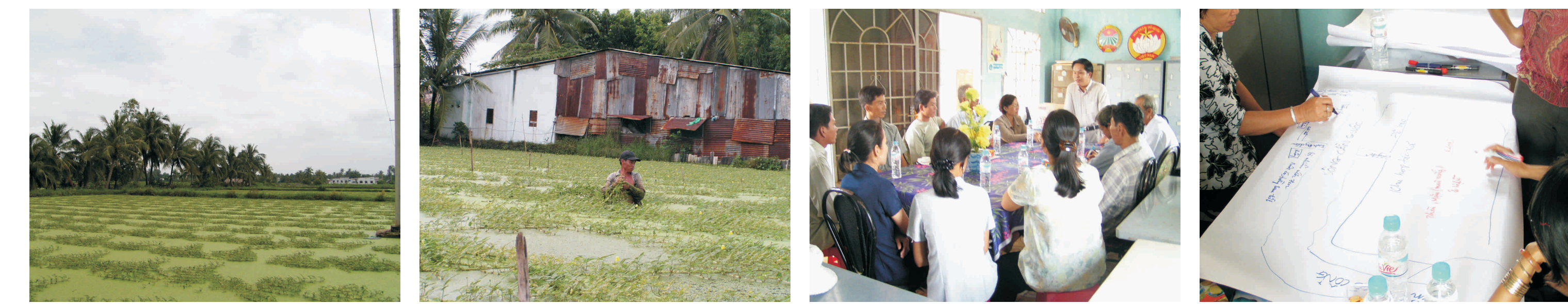
Ao trồng rau nhút, Noãng ñản trình bày về công ñoàng và hệ thống sản xuất (nhóm nữ), Giỏii thiệu mức ñích nuôi PCA, Noãng ñản trình bày về công ñoàng và hệ thống sản xuất (nhóm nữ)