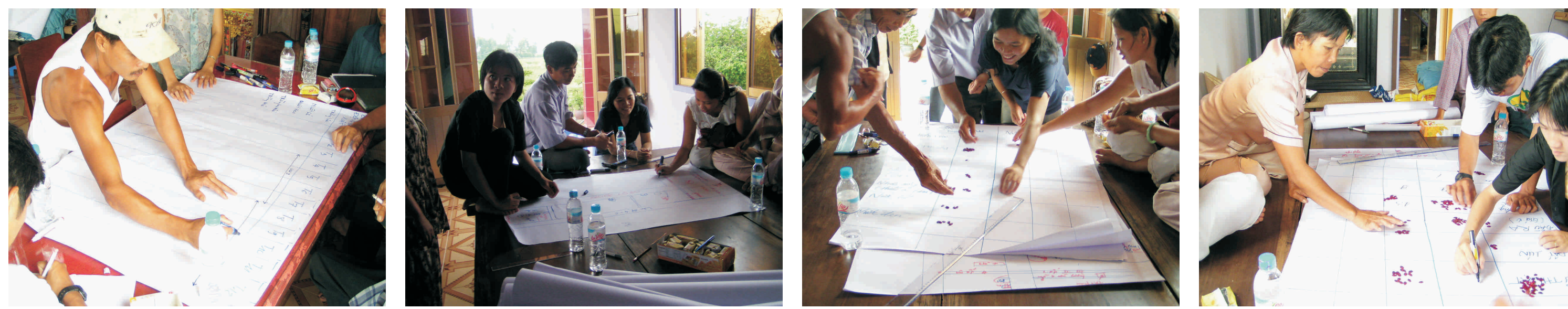
Noãng ñản trình bày mùa vụ sản xuất, Noãng ñản trình bày những khâu khâu trong hoạt ñoàng sản xuất, Tổng kết và xếp loại những khâu khâu