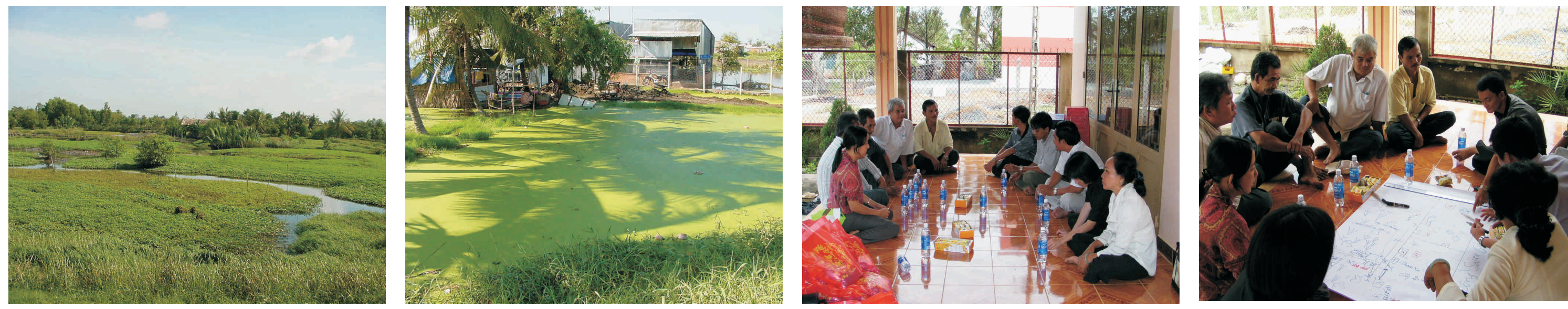
Ao rau muống, Ao nuôi cá rô, Giỏii thiệu mức ñích nuôi PCA, Noãng ñản trình bày về công ñoàng và hệ thống sản xuất